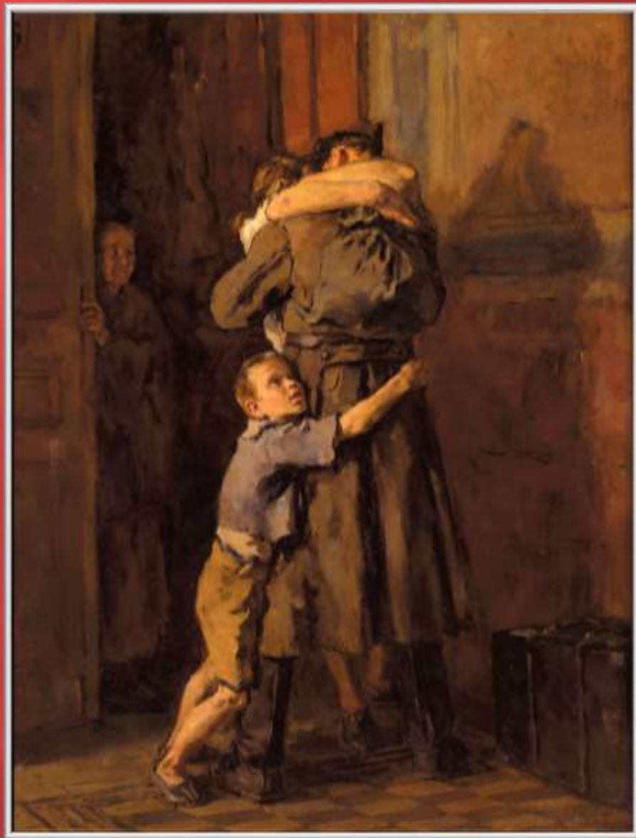
В. Костецкий «Возвращение»