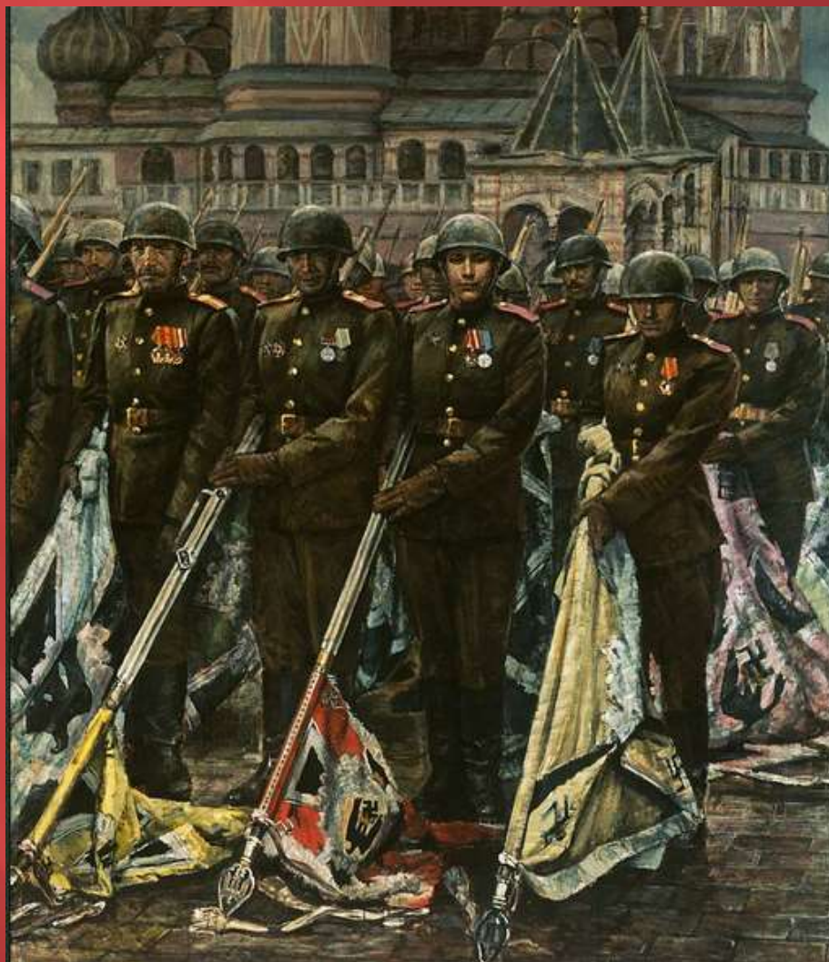
К.М. Антонов «Победители»