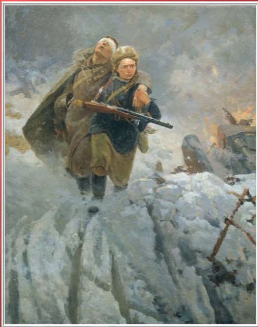
«Сестрица». Самсонов М.И.